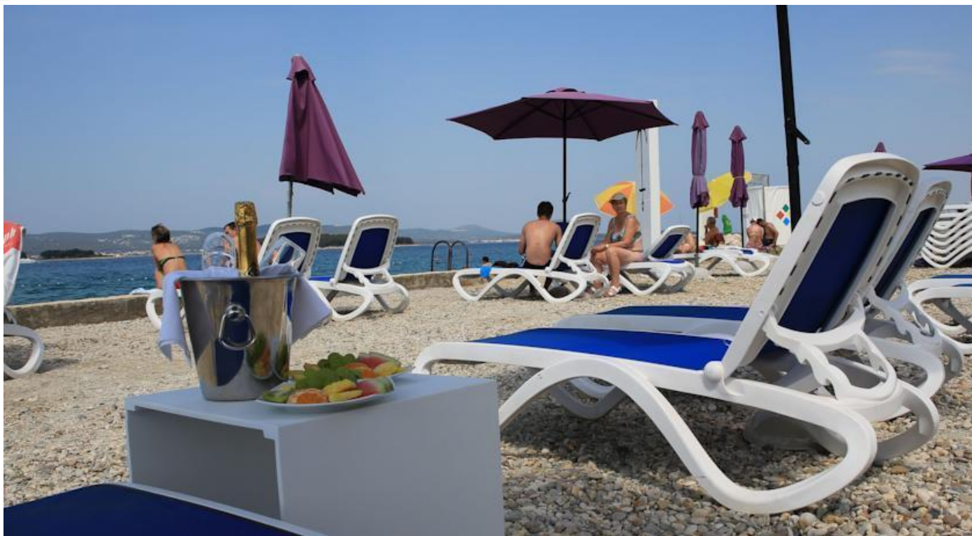
Plaža kompleksa Ilirija Resort Hotels&Villas.